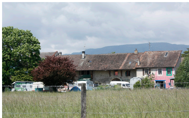
le nouveau camping du village