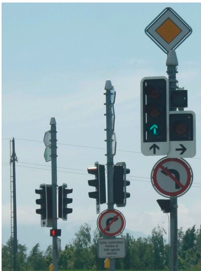
de plus en plus compliqué