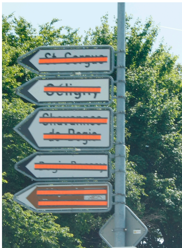
rayés de la carte ?