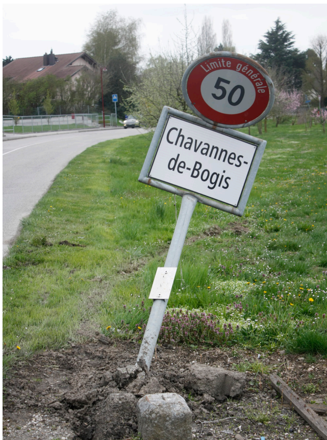
coup de bise ou nouvel aérodynamisme ?