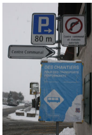
La mobilité ne tient qu'à un fil ...