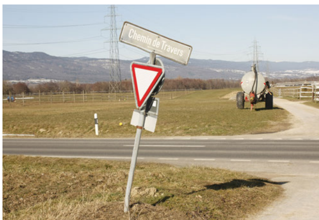
Un chemin baptisé par un visionnaire