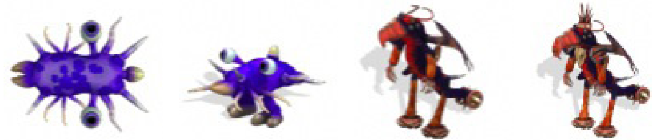
Evolution de la créature Teken de la cellule à la Tribu.

Comme dit plus haut, nous partons de rien du tout à l'espace. L'histoire se découpe en cinq grandes parties : la Phase Cellulaire, la Phase Créature, la Phase Tribu, la Phase Civilisation et la Phase Espace.