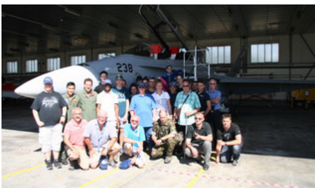
Pouvoir toucher un FA 18... que du bonheur