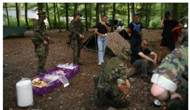
Mise en place du bivouac sous les conseils des explorateurs