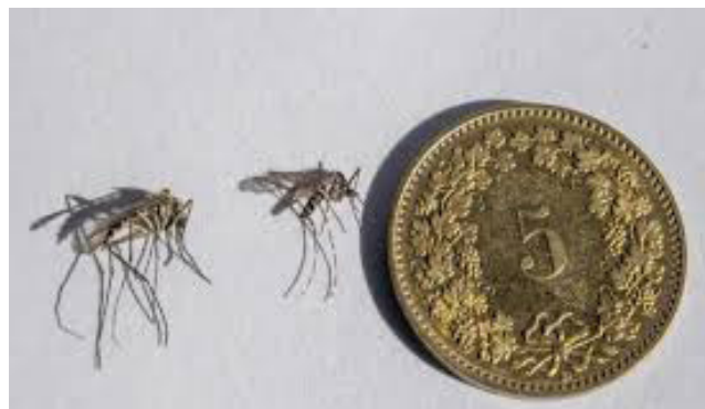
à gauche, moustique habituel, à droite moustique tigre

endroits propices à sa reproduction. Il est donc capital d'assécher tous les petits points d'eau présents dans nos jardins ou sur nos balcons. Arrosoirs, sous-pots, bidons de récolte d'eau de pluie, bâches mal pliées ou n'importe quel récipient non couvert: la liste est pratiquement infinie. Mais faire l'effort de supprimer ces points d'eau a un effet direct sur la propagation du moustique tigre, étant donné son faible rayon d'action. Les fleurs et plantes en pot, dans de la terre, ne posent pas de problème.