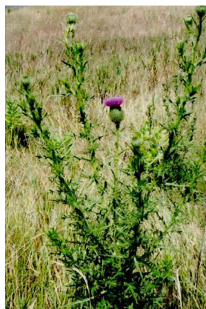
Le cirse vulgaire

En quoi ces trois plantes sont-elles nuisibles ?