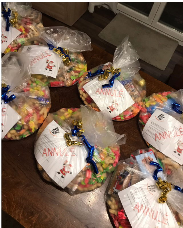
les friandises prévues pour la venue du père Noël ont été distribuées aux élèves de notre école

L'auberge aussi fermée ? Mais non, ouverte à nouveau depuis le début février (voir p.5).