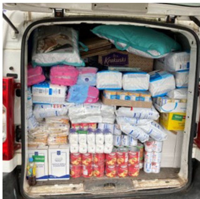
Le fourgon bien rempli et la livraison à Cherkasy