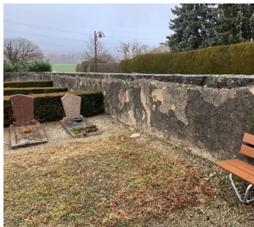
Murs sales qui s'effritent