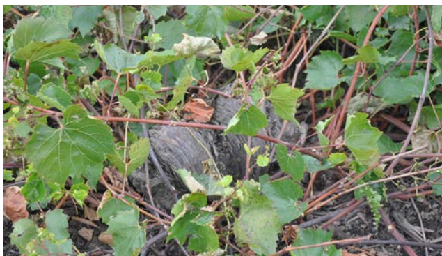
La vigne en octobre

l'indique, ils ont pour but de recevoir des greffons qu'ils rendront résistants à ce parasite néfaste.