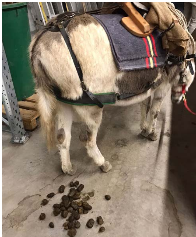
Pomponette a laissé des souvenirs !