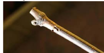
Préparation avant greffage Greffon*

Le spectacle qu'offre ce bout de terre est un rare privilège que nous devons aux frères Dutruy, viticulteurs dans la commune de Founex, qui sont l'un des plus grands multiplicateurs de vigne de Suisse. En effet, sur les 7 hectares de terrain accordés à cette activité sur toute l'étendue du territoire suisse, ils en exploitent 3.