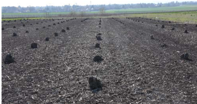
La vigne en mars

Nous sommes nombreux à nous interroger sur ce petit lopin de terre situé en face de l'entrée du parking de l'hôtel Everness de Chavannes-de-Bogis. Il se démarque nettement des autres parcelles par des moignons ligneux couleur de sarments de vigne qui le parsèment et lui donnent des allures de paysage lunaire.