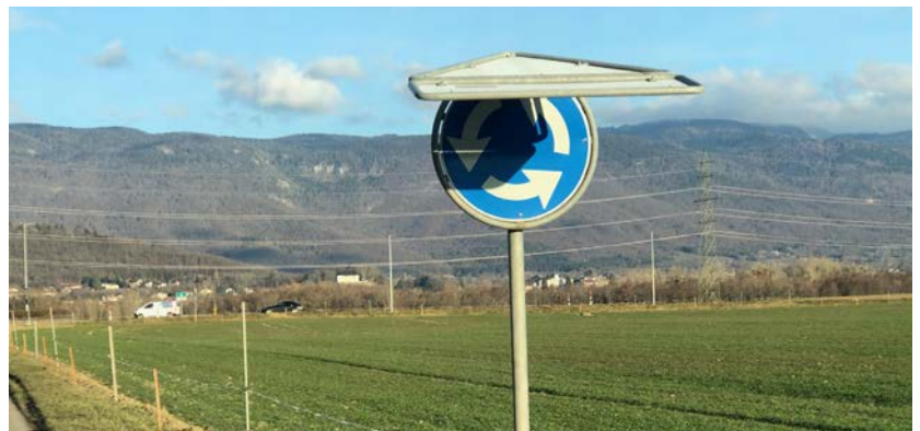
Les effets de la tempête de bise du 26 février.