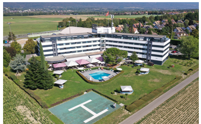
Everness Hôtel en 2023