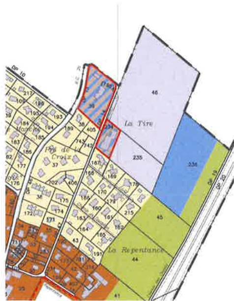
Fig. 5 : Extrait du plan général d'affectation en vigueur (2013)

Les opposants contestent l'identification de ces terrains en surface d'assolement (SDA), n'ayant jamais été consultés dans le cadre de la procédure. À noter que le plan d'affectation communal mis à l'enquête ne concerne pas les SDA.