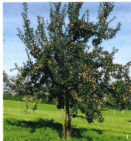
Arbre fruitier haute tige